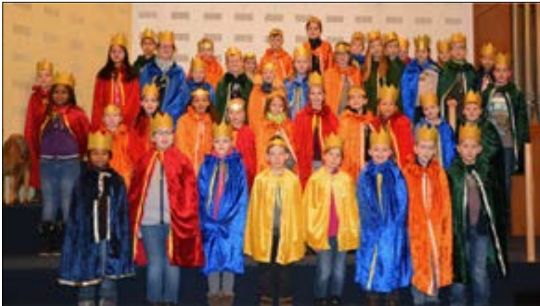
Sternsinger in Heilig Geist